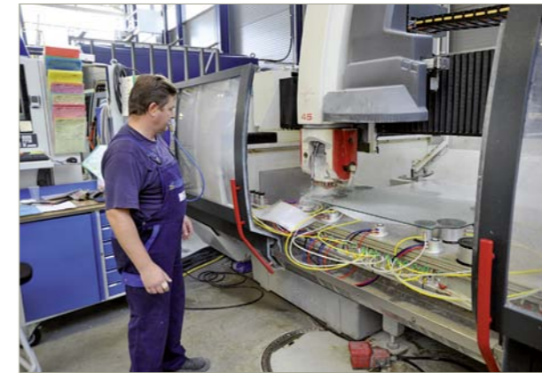
Links: Das brandneue, fünfschichtige CNC-Bearbeitungszentrum. Ein vertikales Schleif-, Bohr- und Fräszentrum ergänzt das High-Tech Bearbeitungsequipment. Rechts: Mit Einführung der ESG-Fertigung in 2008 wurde Frerichs Glas vollends zum Vollsortimenter im High-Quality Segment.