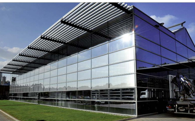
Links: 2008 wurde die 'Gläserne Fabrik' eingeweiht, in der die Bereiche creaglas®, creacryl® und Logistik untergebracht sind. Rechts: Der Zuschnitt wurde immer wieder den gestiegenen Anforderungen angepasst, so jüngst durch Aufstockung des Float-Remasters.

Dank durchgängiger Barcodeverfolgung wissen nicht nur die Mitarbeiter in der Produktion jederzeit, wo sich jede Scheibe befindet; die Bearbeitungsstati werden auch ins A+W ERP-System zurückgemeldet, so dass Kundennachfragen unmittelbar beantwortet werden können: Transparenz durch konsequenten vernetzten Softwareinsatz in allen Unternehmensbereichen.